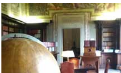
Serata 12 novembre (23 presenze) Visita Biblioteca Putti