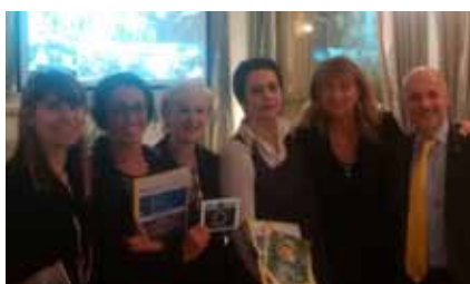
Serata 7 novembre (31 presenze) Service Montecatone