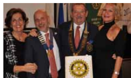
Serata 21 novembre (49 presenze) Visita del Governatore